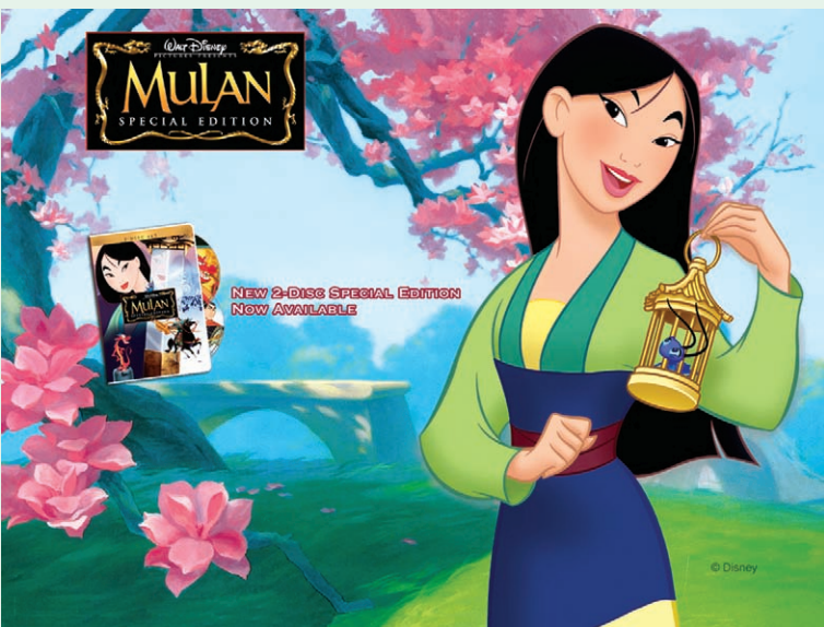
图5《花木兰》中主角形象