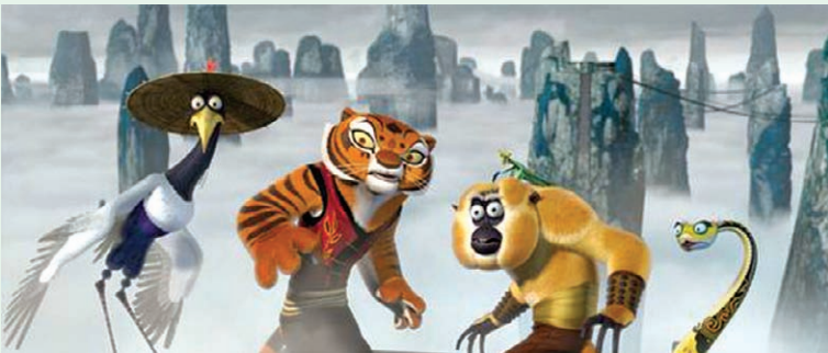
图4《功夫熊猫》中“五侠客”