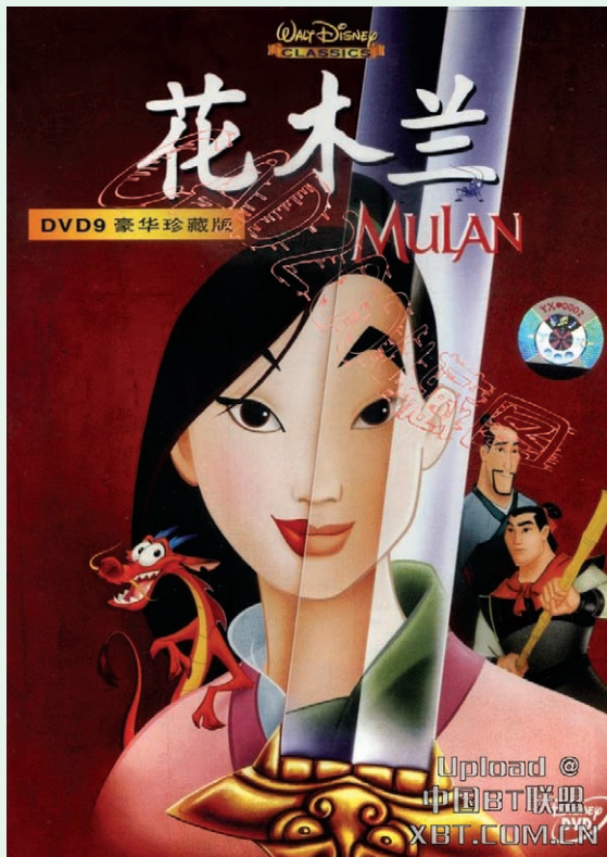
图5《花木兰》中主角形象