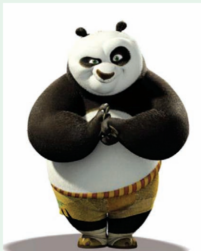
图1 《魔比斯环》中主角形象